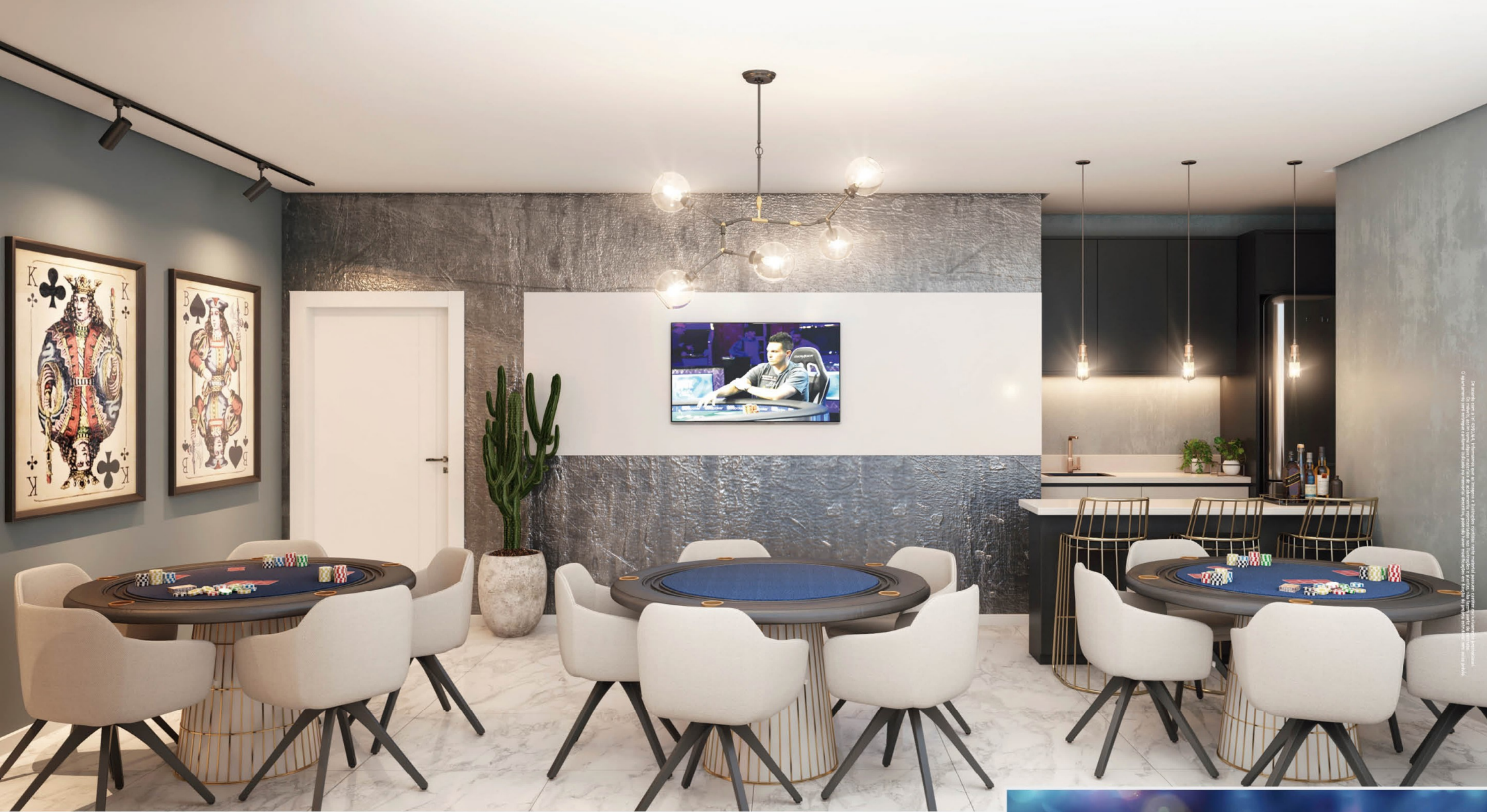
SALA DE POKER COM BAR