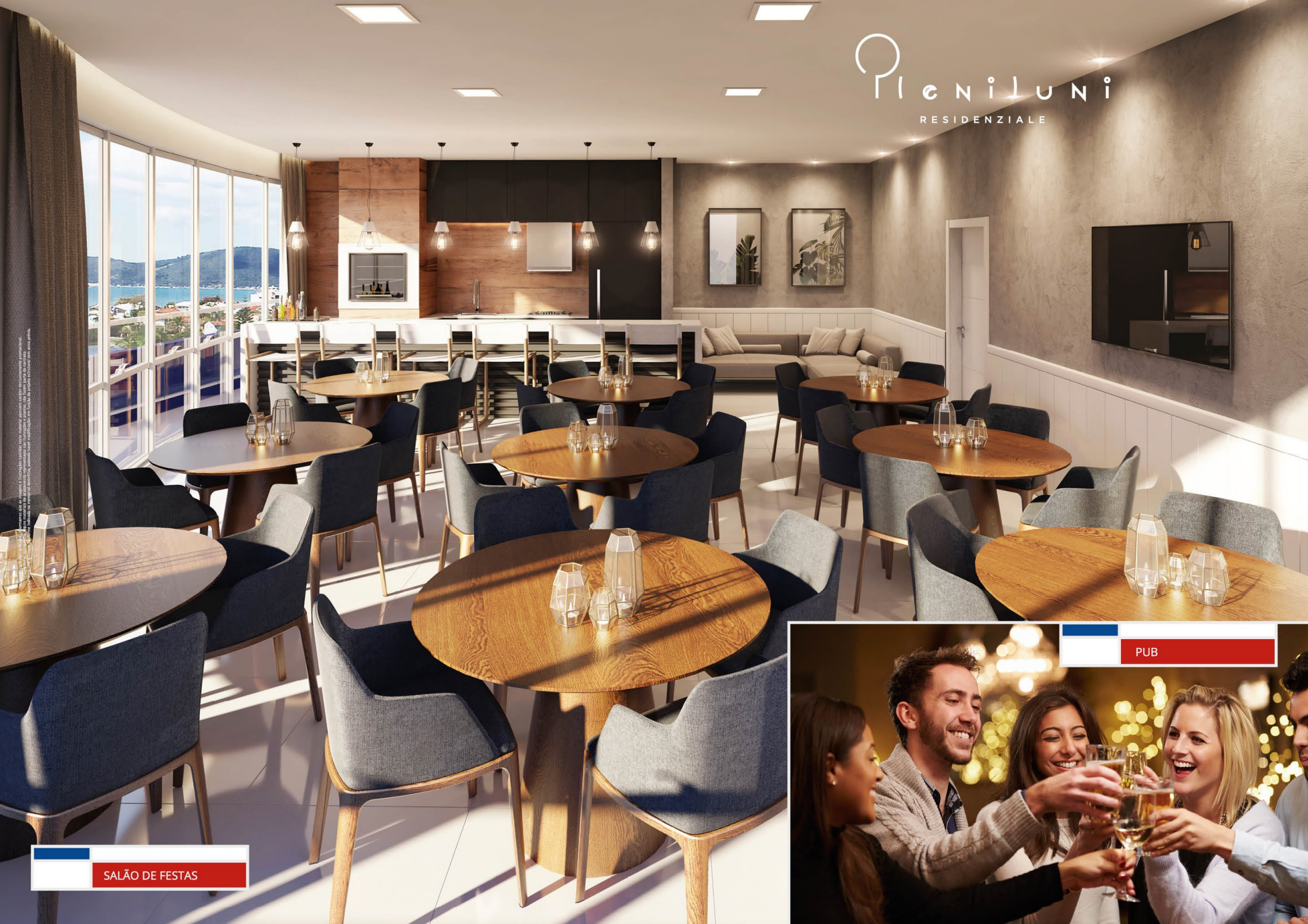
Imagem meramente ilustrativa. Não é uma fotografia real. O projeto é apenas uma referência visual. Não é uma fotografia real. O projeto é apenas uma referência visual.