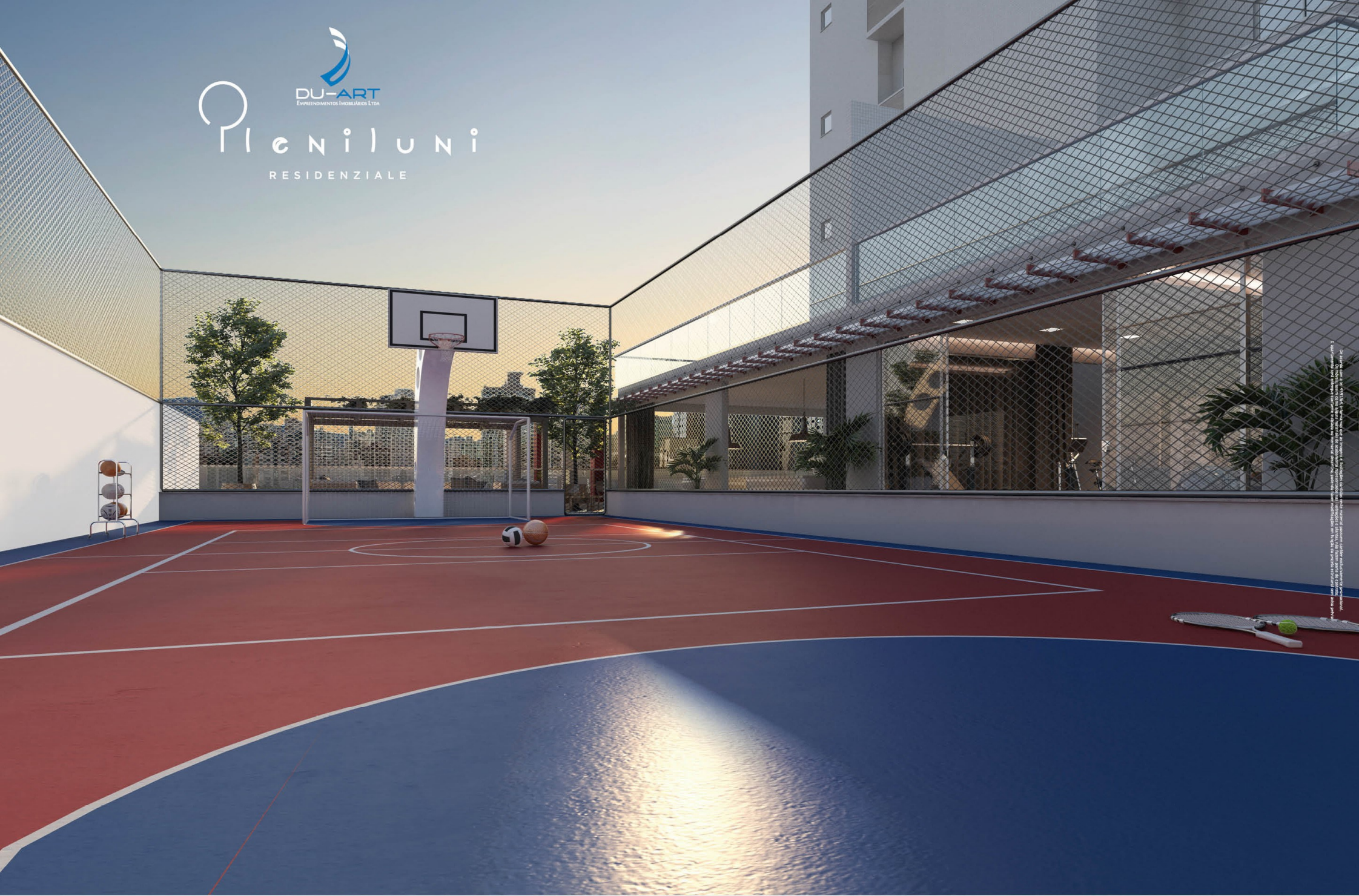
Imagem meramente ilustrativa. Não é uma fotografia real. O projeto é de autoria da DU-ART Empreimentos Imobiliários Ltda. Todos os direitos reservados. Proibida a reprodução total ou parcial sem a devida autorização por escrito da DU-ART Empreimentos Imobiliários Ltda. A DU-ART Empreimentos Imobiliários Ltda. não se responsabiliza por danos materiais ou morais decorrentes do uso indevido das informações aqui divulgadas. A DU-ART Empreimentos Imobiliários Ltda. não se responsabiliza por danos materiais ou morais decorrentes do uso indevido das informações aqui divulgadas.